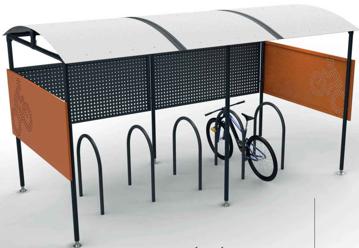
ABRI TOUT  QUIP 